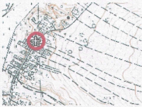
Orientacja skala 1:10 000

Nie wyklucza się istnienia innych nie wykazanych na mapie urządzeń podziemnych, których nie zgłoszono do inwentaryzacji lub dla których brak jest informacji branżowych.