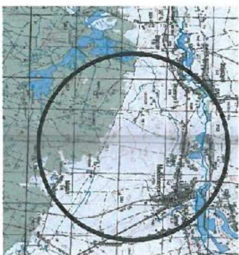
Podział na arkusze

GEODETA UPRAWNIONY imię: Grzegorz, nazwisko: Druszek numer uprawnień: 1111111111 data: 03.06.2016 podpis geodety uprawniającego wykonawcę