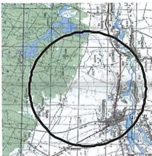
Podział na arkusze