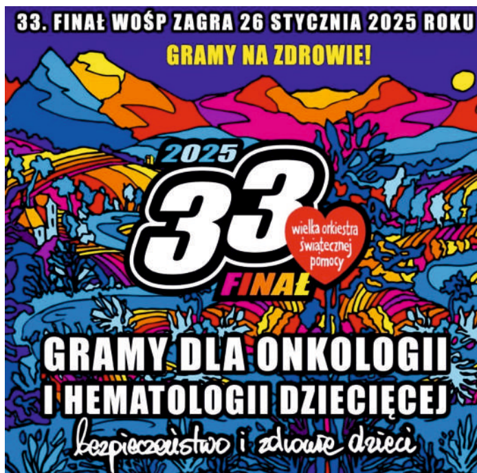
A. Rząd foto. arch. GOK