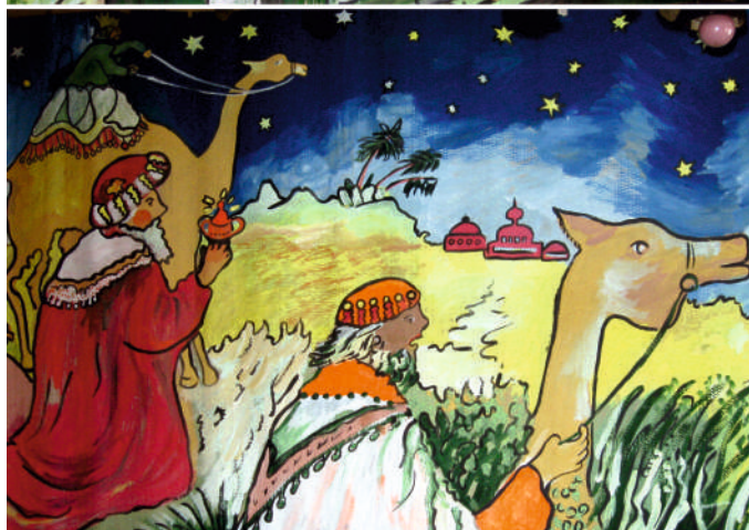
Malarstwo olejne Irena Rowicka

Dane, dotyczące statystyki urodzeń i zgonów, podawane są na podstawie dokumentów otrzymywanych z innych Urzędów Stanu Cywilnego.